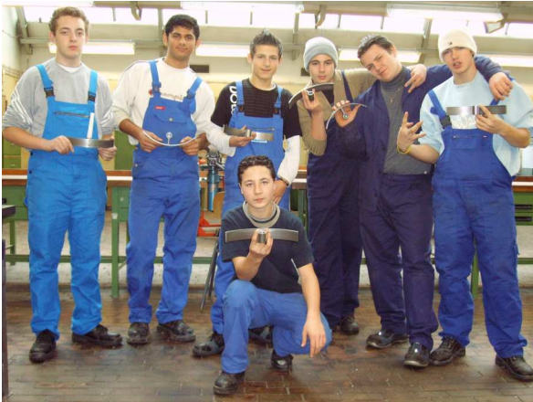
Ergebnis des Projektes handgefertigte Metall-Kerzenständer

Jeder Schüler hat einen eigenen, nach neuester Technik ausgerüsteten Arbeitsplatz.