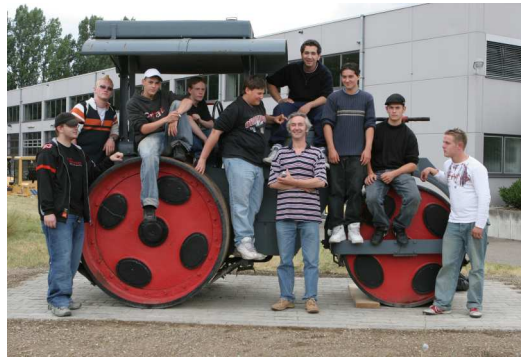
Abschluss des Projektes Baumaßnahmen für den Standort Baumaschine

Eine Prüfung in Englisch kann nur erfolgen, wenn der Unterricht das ganze Jahr über besucht wurde.